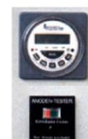
Reloj horario y ánodo tester de serie