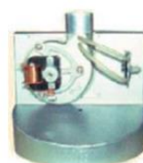
Ventilador para evacuar los gases de combustión